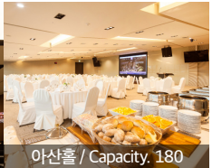
아산홀 / Capacity, 180