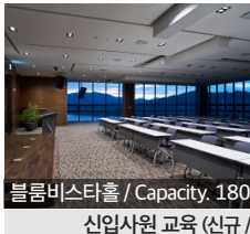
블룸비스타홀 / Capacity, 180