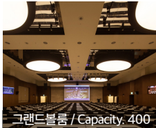
그랜드볼룸 / Capacity, 400