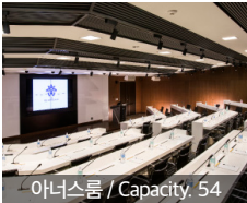
어니스트룸 / Capacity, 54

블룸비스타는 대·중·소 타입별 총 40개 강의장을 보유하고 있으며, 최신 교육·연수 시설을 갖추고 있습니다. 소규모 교육부터 대규모 행사에 이르기까지 다양한 목적에 부합하는 행사 진행이 가능합니다.