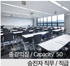
중강의장 / Capacity, 50