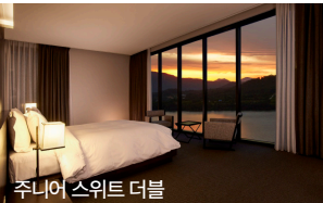
주니어 스위트 더블

신입사원부터 임원, 대표까지 고려한 다양한 객실은 행사의 만족도를 높여 드립니다.