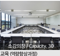
소강의장 / Capacity, 30