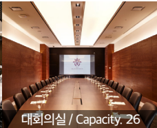
대회의실 / Capacity, 26