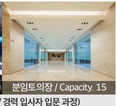
분임토의장 / Capacity, 15