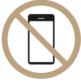
사우나 내 핸드폰 사용 금지