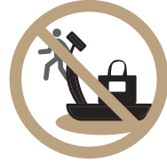
기구 선점 금지

피트니스 내에서 회원에게 강압적인 선물, 향응의 제공이나 대가성의 물품 요구는 절대 불허합니다.