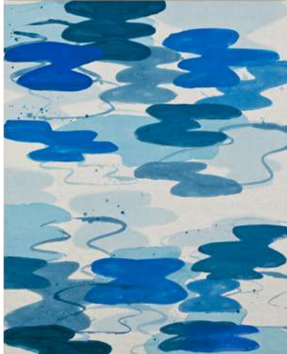
Acrylic on canvas, 162 x 130cm, 63.8 x 51.2 in.

기간 2024년 5월 7일 (화) - 7월 1일 (월) | 장소 클럽동 로비 | 문의 02 2250 8077