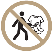
클럽 물품 외부 반출 금지 (운동복, 양말 등)