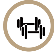
기구 사용 후 정리