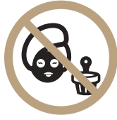
사우나 내 흡연, 팩, 유리제품 사용 금지