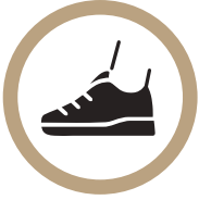
운동화 착용 후 입장