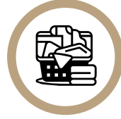
사용한 물품 수거함에 버리기 (운동복, 타올 등)