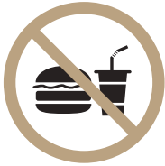
음식물 반입 금지