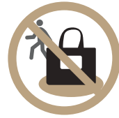
공용공간(탕 내, 파우더룸)에서의 자리 선점 금지