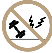
매너있는 기구 사용