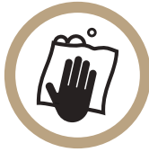
자리 이용 후 정리