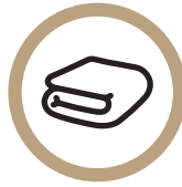
타올 사용 최소화 동참