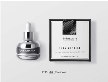
PDRN 앰플 (20ml/box)

10월 1일부터 11월 31일까지 2개월 간, 갤러리 인숍에서 전세계 42개국 의사들로부터 극찬을 받은 메디컬 럭셔리 코스메틱 브랜드 에스터액션을 선보입니다. 세포 재생에 효과적인 고급 의료용 원료를 사용하여 개발된 에스터액션은 속 피부 개선을 통한 피부 본연의 생기와 활력을 되찾아 주는 고기능성 안티에이징 스킨케어 브랜드입니다. 4개의 안티에이징 스킨케어 연구소와의 협업을 통해 개발되었으며 특히 PDRN 앰플은 연어의 DNA에서 추출한 재생물질 PDRN이 5,000ppm 함유되어 피부 세포 재생을 통한 피부 탄력 개선 및 빠른 진정 효과를 주는 에스터액션의 대표 제품입니다. 에스터액션은 반얀트리 갤러리 인숍 입점을 기념하여 다양한 이벤트를 진행하며 입점 기간 중 제품을 구매하는 고객을 대상으로 피부 상태 진단을 통해 개인 맞춤형 솔루션을 제안하고 피부 경과를 체크해볼 수 있는 기회를 제공합니다.