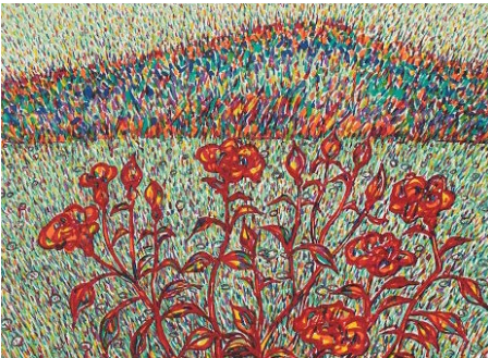
<이대원, Farm, Lithographie Originale, 44x61cm ed.100>