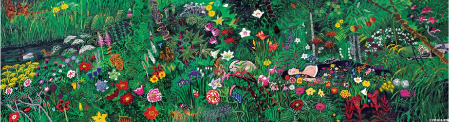
<김종학, No.7 파라다이스, Silkscreen, 36x131cm ed.150>

9월에는 가을의 향기를 담은 근현대 에디션 작품들로 구성된 특별전 <어텀 브리즈>가 펼쳐집니다. 이번 전시는 한국 화단을 대표하는 김환기, 이대원, 김종학 작가의 판화 작품들을 한 자리에서 볼 수 있는 기회로 화가들의 고유한 작품 형식과 특성을 그대로 담고 있으면서도 대중성을 함께 지닌 에디션 작품들을 선보입니다. 가을의 길목에서 분주한 일상을 잠시 내려 놓고 마음의 심과 여유를 찾아 보세요.